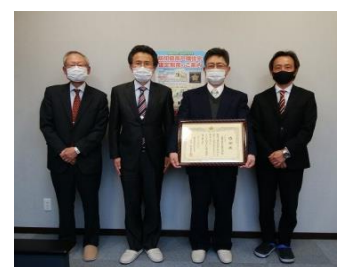
左から2番目杉本部長様