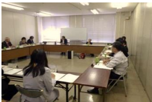
推進協議会の模様

令和7年11月12日、「第2回 犯罪のない安全で安心な三重のまちづくり推進協議会」が開催され、令和8年度で期間が満了する『安全で安心な三重のまちづくりアクションプログラム第3弾』の次期計画案について改訂に関する議論が行われました。会議では、特殊詐欺への対策についてもこれまでの「高齢者を守る」という観点に加え、若年層を含めた全世代への被害拡大を踏まえた新たな取り組みの必要性が議論されました。