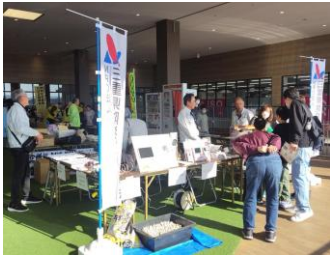
展示ブースの様子

令和7年12月7日イオンタウン松阪船江にて「安心・安全フェスタまつさか」が盛大に開催されました。